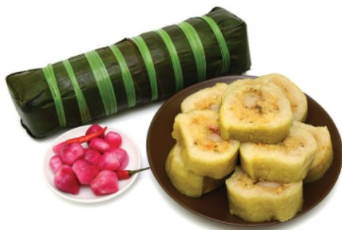
ベトナムの正月料理 (Banh Tet)

庶民も正月ばかりは奮発してよい食材を求めます。から年末の市場は大混雑。正月に欠かせない料理は