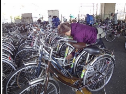
川崎市提供自転車ダナン・クアンナムのともだちへ「日本ベトナム友好協会」のシールと今回は川崎市のシールも一緒に貼りました。

4月のバザーは 4月12日(土) 午前9時30分より ご協力をお願いします。 土・日・祭日は休みです。