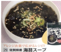
アレンジ次第で広がるレシピ!! 29 佐賀県産 海苔スープ