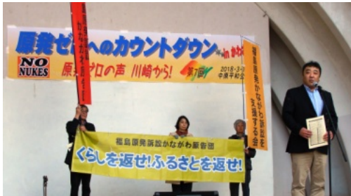
3. 11原発ゼロカウントダウン・in川崎

いま福島が切り捨てられようとしているが「つながっていけば私たちは負けない！」を合言葉にがんばる決意が述べられました。