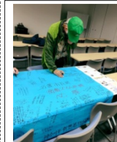
「新基地建設にたのしみ」の書き。反対への書き。