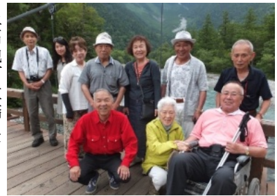
上高地河童橋にて 7月18日

7月17日から二泊三日、「任意後見友の会」の女性4名と男性7名で川崎市八ヶ岳自然少年の家を利用してバス旅行をしました。一日目は中山道馬籠宿散策。「木曾路はすべて山の中である」の名文に魅せられて訪れる方も多いでしょう。石段のきつい坂道や長く出たひさし、太い垂木に山の生活の厳しさが思われます。余裕があれば脇本陣や藤村記念館を訪ねてみたいですが、またの楽しみに。