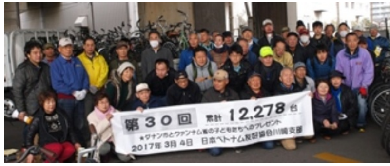
ボランティアで参加していただいた皆さん=3/4日 今回でのべ12,278台になりました。

3月4日、ベトナムに贈る自転車作業に、事前の記者会見などを通じて新聞各紙の案内を見たとの参加申し込みも多くあり約60名の参加者が(初めての参加者10名)ボランティアで参加してくれました。