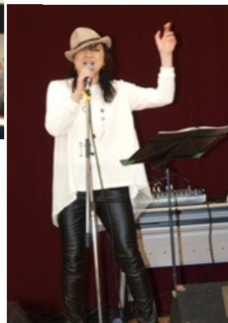
ザ・のんべーずのボーカリスト

の強さを踊る、身の引き締まる思いで見入りました。ザ・のんべーずの演奏には、いつもながらダンスの応援。楽しげに踊る様子にスマホやカメラがまわっていました。