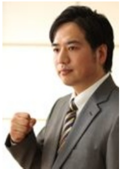
くらしの相談セ ンター所長代理