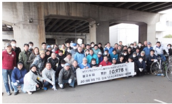
ベトナムへの自転車作業に参加されたボランティアの皆さん=3/7

3月7日(土)、雨降り でも寒い日でしたが、 今回NECの会社から 39名、向の岡工業高校が 日本・ベトナム友好協会 から4名を含めてボランティア 川崎支部は1コンテナ分 ア総勢76名の参加者でし (325台)ベトナムに贈 た。レンタカー3台を借 る事が出来ました。これ りたこととみなさんの力 まで26回目となり累計は で早く終わることができ 10978台となりまし 本当にありがとうございます ました。