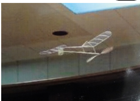
室内軽量模型飛行機(インドアブレーション)世界記録機種=2011.9

これからまた彼が日本に来たらどうしようと怖くなることも有ります。しかしこの時間やエネルギーを、子どもを育てる時間や仕事にあてたいと思います。自分が犯したことの責任を噛みしめて、反省を忘れないようにしていきます。本当に、本当に有り難うございました。深謝申し上げます。